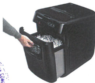
手拉式廢紙箱, 方便傾倒紙屑