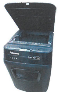
揭蓋式自動碎紙設計